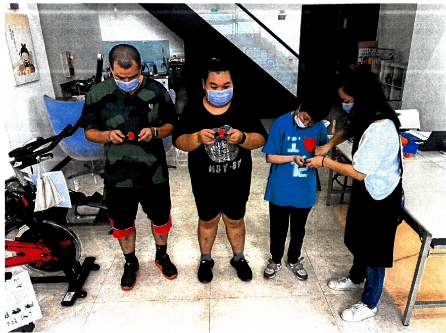
照片說明：照顧服務費 - 社工員課程教學。