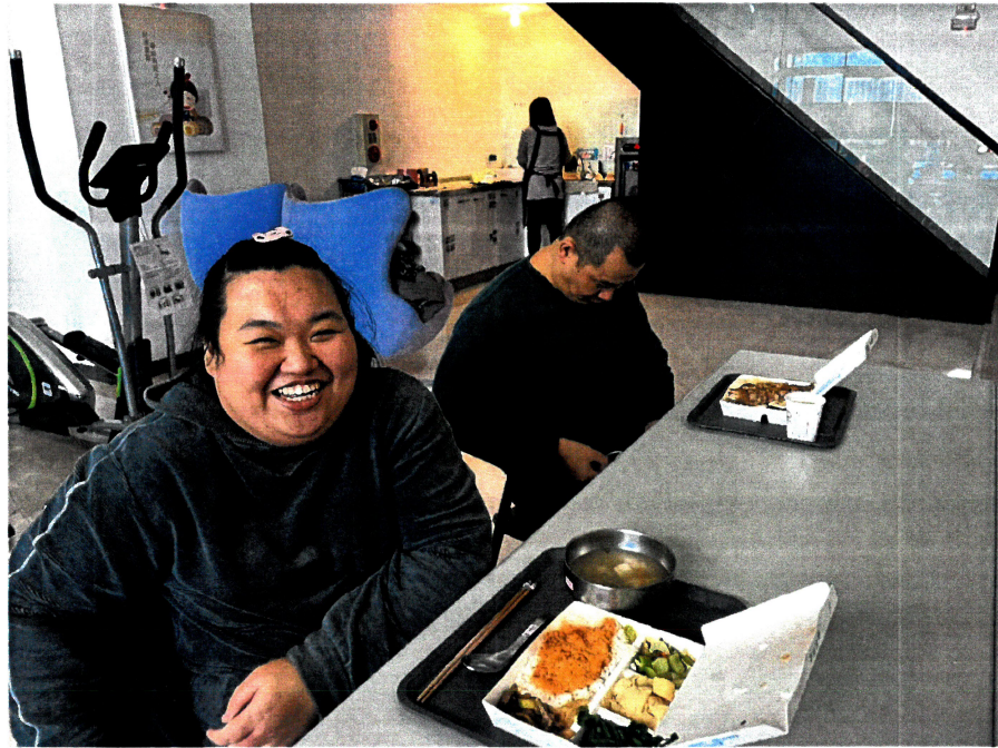
照片說明：營養午餐費 - 服務對象享用美味午餐。