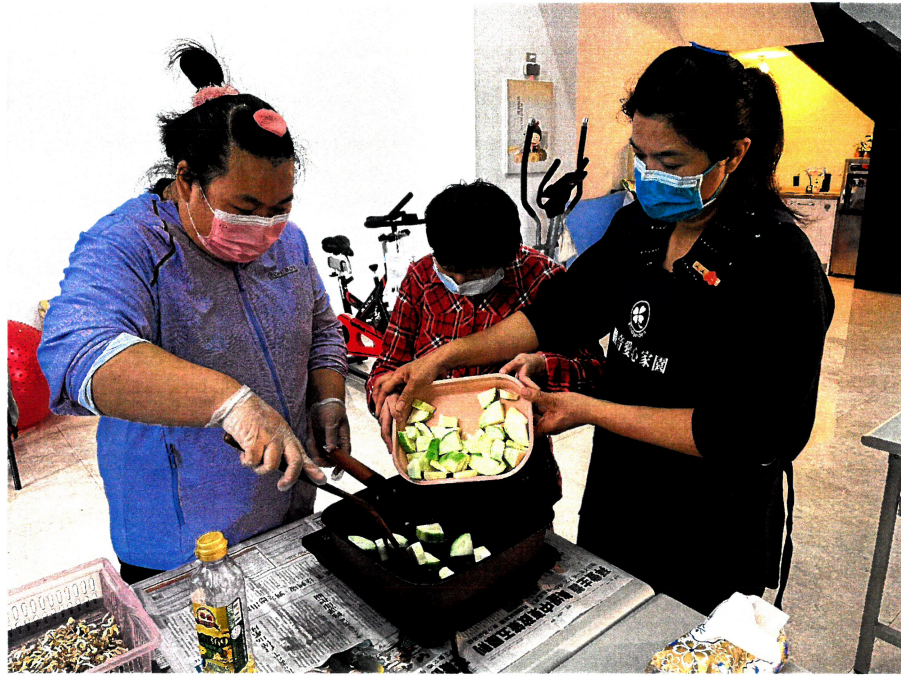
照片說明：照顧服務費 - 教保員課程教學。